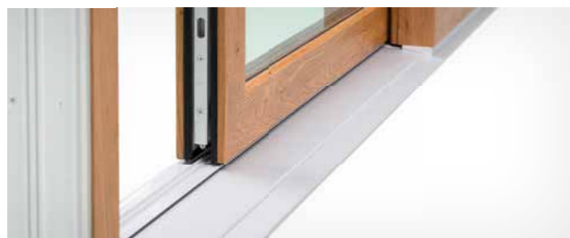
Schliessblech mit Verriegelungspunkten. Veloursdichtung innen, EPDM- und Bürstendichtung außen.