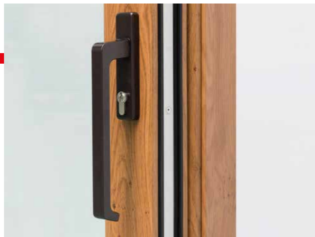
Aluminiumgriffe und Knauf-Griff-Kombi in folgenden Farben: Weiß, Braun, Silber und Hellbraun.