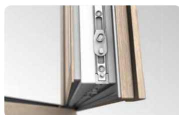
Hochwertige Maco Multi Matic KS Beschläge mit zwei aushebelungssicheren Schließblechen als Standardausstattung.