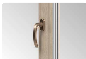
Der elegante Aluminiumgriff unterstreicht das Fenster.