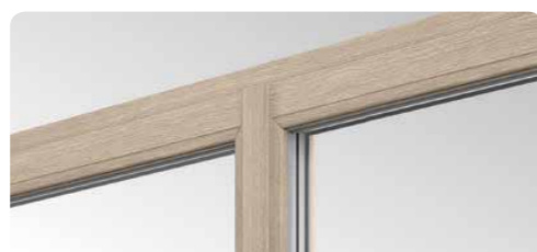
Die schlanken Profile mit schmalem sowie mit doppelter Dichtung ausgestattetem Stulp stellen eine Marktneuheit bei dieser Art von Lösungen dar.